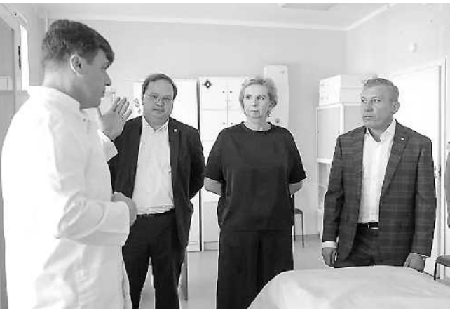
поддержку в комплектовании медучреждений оборудованием оказывает и социально ответственный бизнес.

вичного звена здравоохранения, - отметил Ваге Петросян. - Это повысит эффективность работы врачей, и пациенты смогут проходить диагностику в шаговой доступности, не выезжая для обследования в областной центр. Серьезные заболевания будут выявляться на более ранних стадиях, своевременно назначать правильное лечение, что позволит сохранить здоровье жителей Плесецкого округа. В первую очередь мы спросили самих врачей, какое оборудование им необходимо для работы, и приобрели именно его. В поликлинику оно поступит в ближайшее время. Очень важно, что