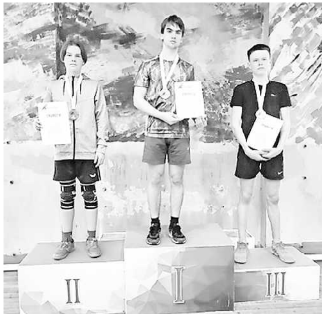
манду "Плесецкий округ" представлял школьный спортивный клуб "Арена"

30 марта 2024 года в спортивном зале Дворца детско-юношеского творчества г. Архангельск прошёл финальный этап областной Спартакиады среди школьных спортивных клубов (ШСК) обучающихся общеобразовательных организаций Архангельской области. По итогам соревнований определялись победители в командном и личном зачётах. В соревнованиях участвовали команды, прошедшие отбор в дивизионном этапе по возрастным категориям - девушки 2005-08 г, юноши - 2005-08г, девочки 2009 г и моложе и мальчики 2009 г и моложе. Всего в каждой категории выступало по 8 команд из городов, районов и округов Архангельской области. Команду "Плесецкий округ" представлял школьный спортивный клуб "Арена"